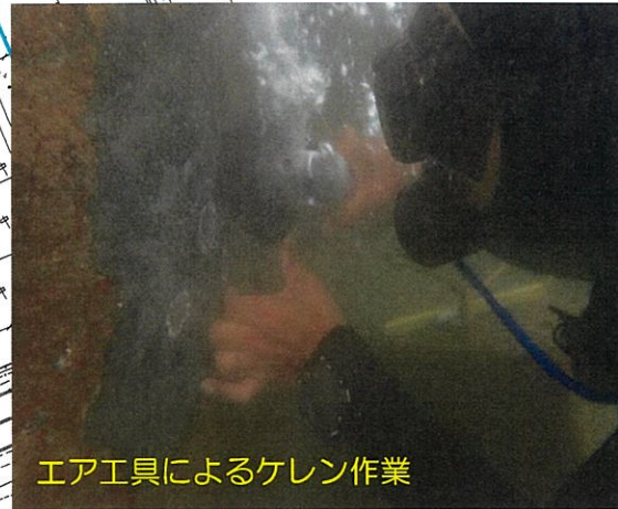
エア工具によるケレン作業