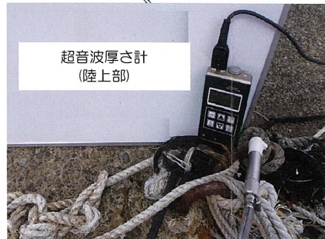
超音波厚さ計 (陸上部)